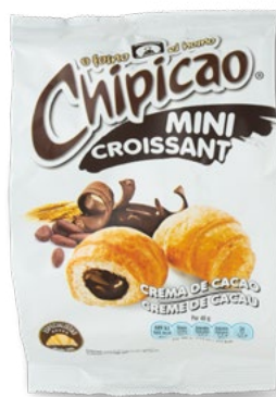
Chipicao Mini Croissants 80g* Mini croissants recheados com creme de chocolate. Mini croissants filled with chocolate cream. € 4'90