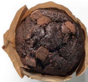
Muffin 90g ☯ Muffin dois chocolates. Double chocolate muffin. € 3'00