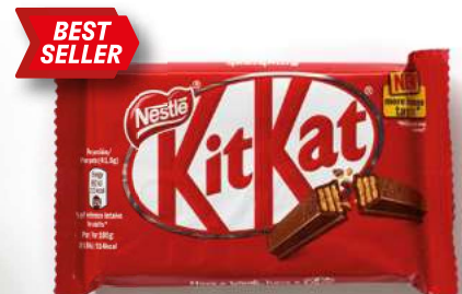
Kit Kat 41.5g ☯ € 2'60